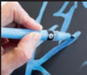
optimale Farbflussregulierung durch kontrollierten Fingerdruck perfect ink flow regulation by controlled squeezing