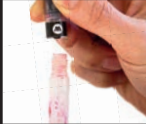
zum Befüllen einfach den Kopf des Markers abschrauben