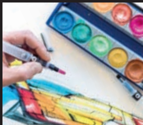
befüllt mit Wasser als ideales Anlöse-Tool für Pigmentfarben filled with water it is a perfect dissolving tool for pigment colors