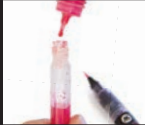
for filling the pen, simply screw off the marker head