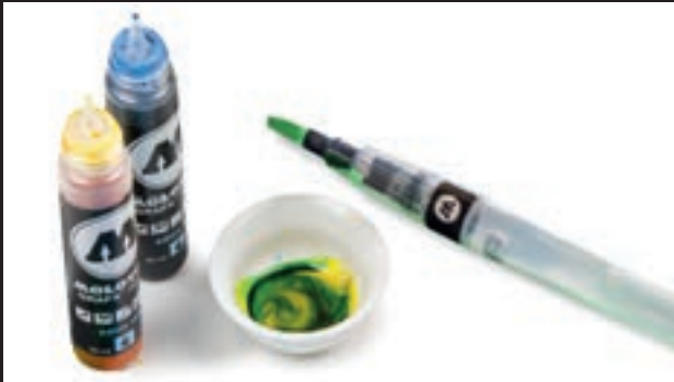
anschließend eigene Farbtöne mischen und mit dem Kolorieren loslegen mix your own colors afterwards and start coloring